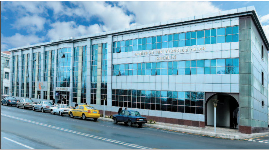
Naxçıvan Muxtar Respublikası Ali Məclisi Sədrinin 2004-cü il 28 fevral tarixli Fərmanına əsasən Naxçıvan Muxtar Respublikasının Rabitə və İnformasiya Texnologiyaları Nazirliyi yaradılmışdır. Ali Məclisi Sədrinin 2014-cü il 19 sentyabr tarixli digər Fərmanı ilə isə Rabitə və İnformasiya Texnologiyaları Nazirliyi Rabitə və Yeni Texnologiyalar Nazirliyi adlandırılmış, nazirliyin səlahiyyətləri daha da genişləndirilmişdir.

Muxtar respublikanın hazırkı sosial-iqtisadi inkişafı rabitə və yeni texnologiyaların rolunu daha da artırmışdır. Son illərdə muxtar respublikada əhaliyə nümunəvi rabitə xidmətinin göstərilməsi məqsədilə konkret vəzifələr müəyyənləşdirilmiş, rabitə sektoruna investisiyaların cəlb edilməsi nəticəsində istismarda olan avtomat telefon stansiyaları müasir tələblərə cavab verən yeni rabitə sistemi ilə əvəz olunmuş, ən ucqar dağ kəndində belə, genişzolaqlı, yüksək sürətli internet və digər müasir telekommunikasiya şəbəkələri istifadəyə verilmişdir.